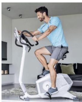
Figure 2: Vélo d'appartement

Il se peut que nous devions vous exclure de l'étude avant le terme prévu. Cette situation peut se produire si par exemple il y a un problème technique ou que le test de grossesse est positif.