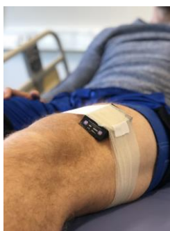
Figure 4 : appareils attachés à la cuisse