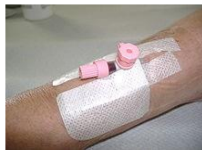
Figure 5 : cathéter pour prise de sang