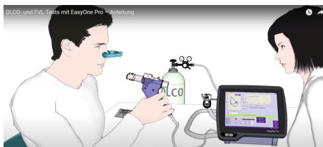
Figure 3: appareil pour mesurer de la fonction pulmonaire