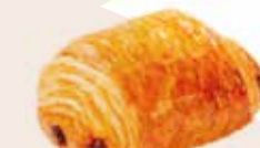
Pain au chocolat