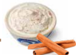
Séré avec de la cannelle